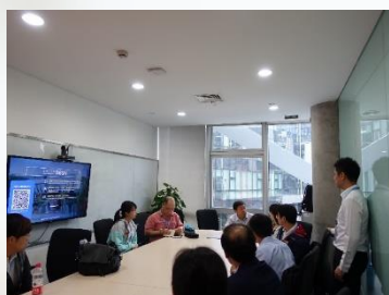
移地教學-中國大陸阿里巴巴