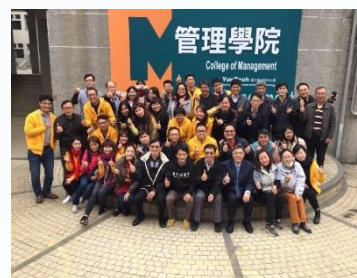
跨屆創意思考競賽