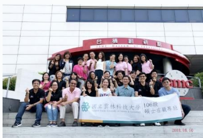
校外參訪-台積電創新館